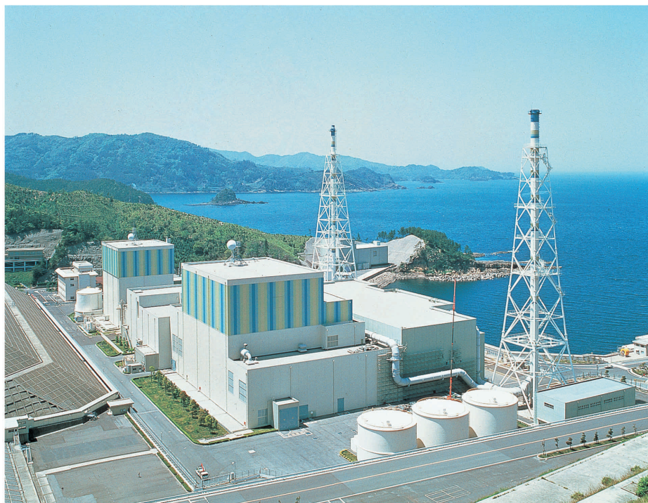
島根原子力発電所

※フライアッシュセメントB種およびC種は国等による環境物品等の調達の推進等に関する法律（グリーン購入法）の特定調達品目に指定されています。