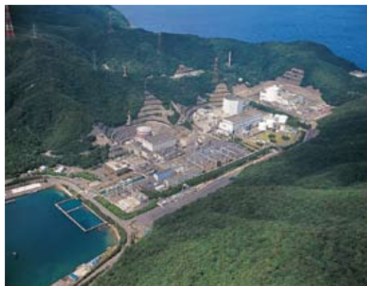
敦賀原子力発電所