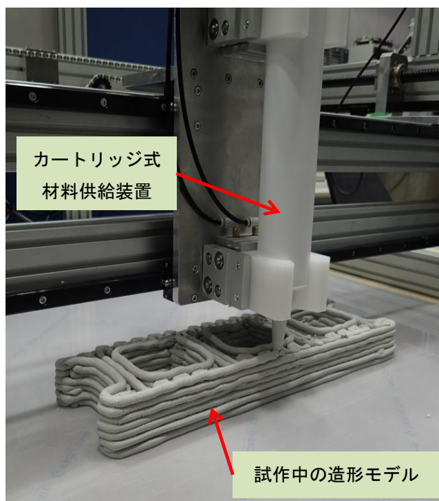
(写真①) カートリッジ式供給機構を搭載した3Dプリンタによる造形状況