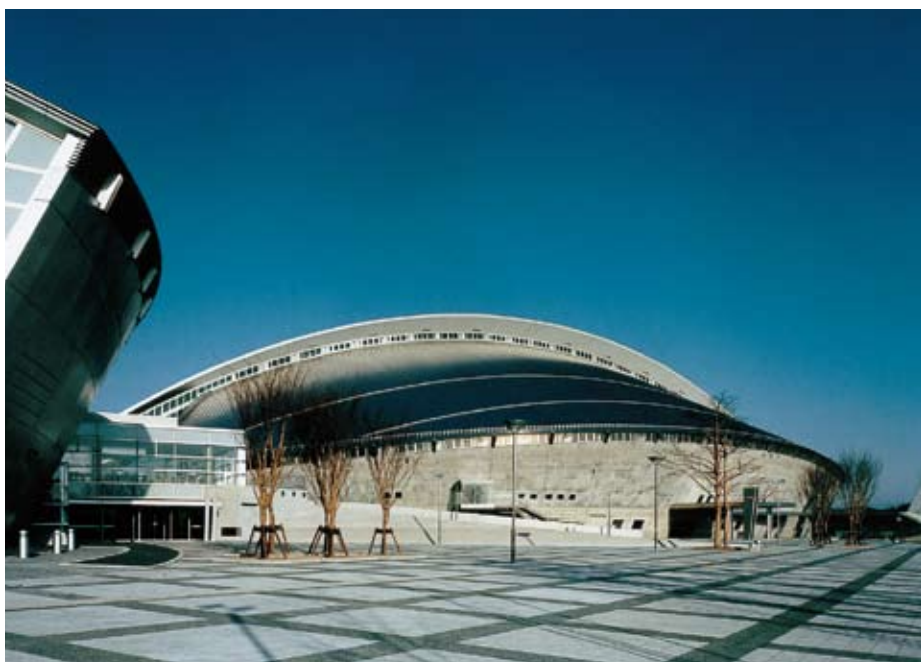
宮城県総合運動公園総合体育館