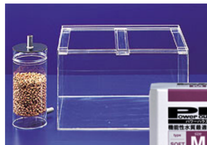
●外部フィルターにパワーハウスソフトタイプ M サイズを使用した例 (60cm水槽)