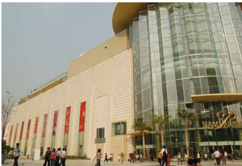
サイアムパラゴン