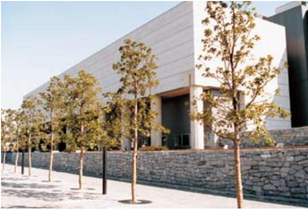
東京都立現代美術館