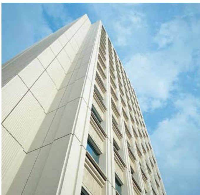
住友生命ビル (高松市)