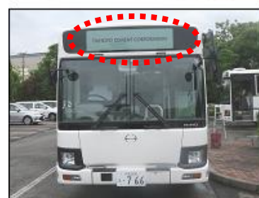
【目印】フロント部の「TAIHEIYO CEMENT」表示