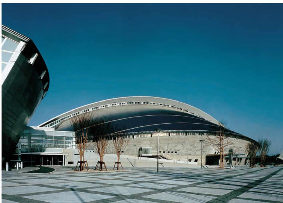
宮城県総合運動公園総合体育館