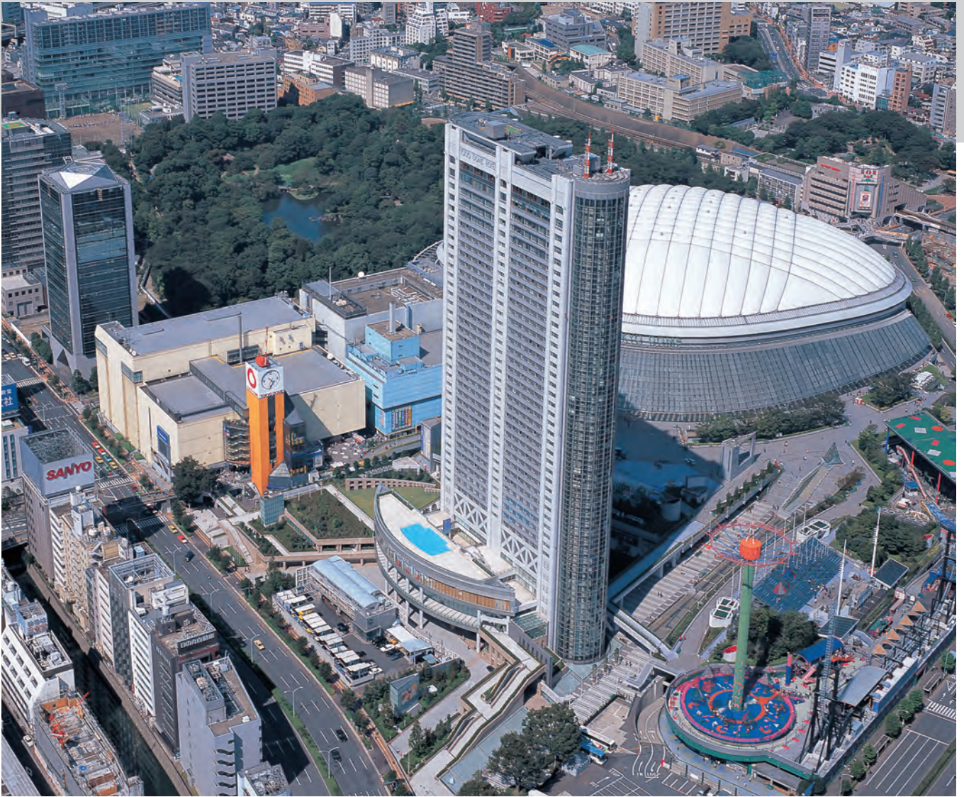
東京ドームホテル