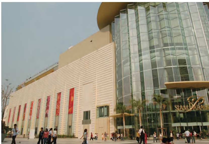
サイアムパラゴン