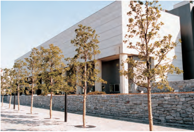
東京都立現代美術館