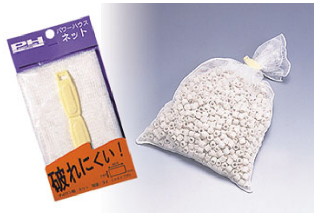
破れにくい仕様です。(500円)

パワーハウスを各種フィルターにご使用になる時、このネットバッグにパワーハウスを入れてる過槽に納めると、後々のメンテナンスに大変便利です。